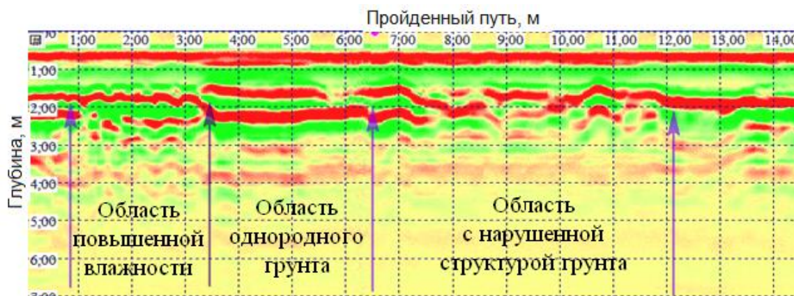
Рис.2. Результат обследования состояния подземных коммуникаций георадаром Герад-3.