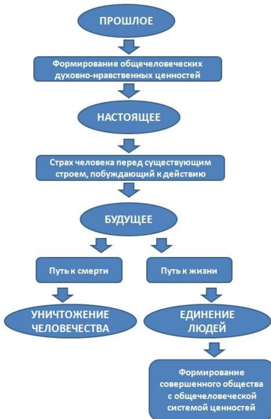
Рис. 1. Идея формирования гуманистического общества К. Ясперса.

формирования мировой культуры с системой общечеловеческих духовно-нравственных ценностей.