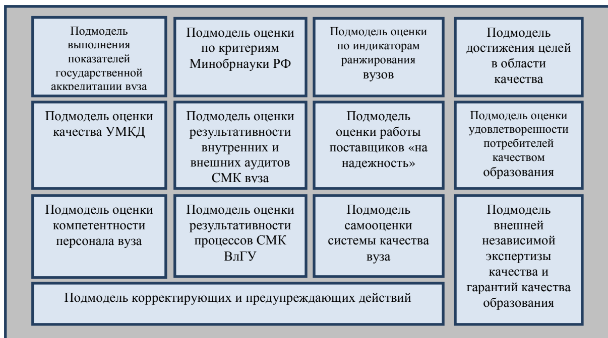
Рис. 1. Состав подмоделей СМОК ВлГУ