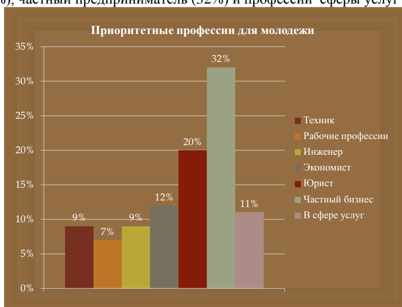
Рис. Приоритетные профессии для молодежи

Так же было предложено выбрать приоритетную на сегодняшний день профессию. Результат выбора таков: техник (9%), рабочие специальности (7%), инженер (9%), экономист (12%), юрист (20%), частный предприниматель (32%) и профессии сферы услуг (11%).