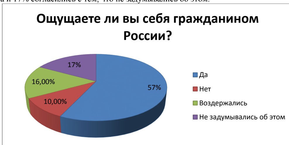
Рис. Вопрос «Ощущаете ли Вы себя гражданином России?»

Мной был проведен опрос среди 100 студентов. На вопрос: «Ощущаете ли вы себя гражданином России?» 57% ответили положительно, 10% - отрицательно, 16% - воздержались от ответа и 17% согласились с тем, что не задумывались об этом.